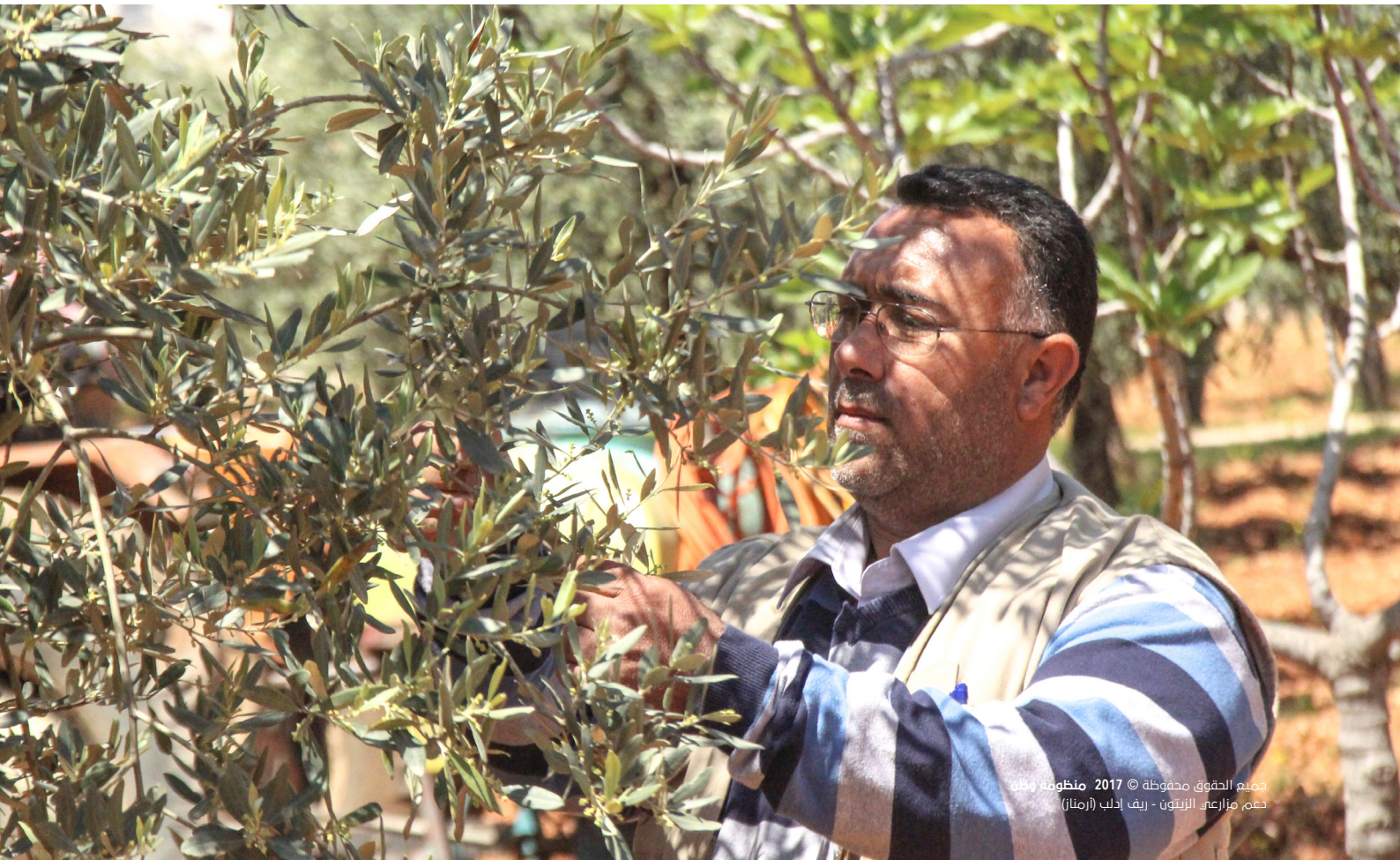
جميع الحقوق محفوظة © 2017 منظومة وطن تعم مزارعي الزيتون - ريف ادلب (ارمناز)