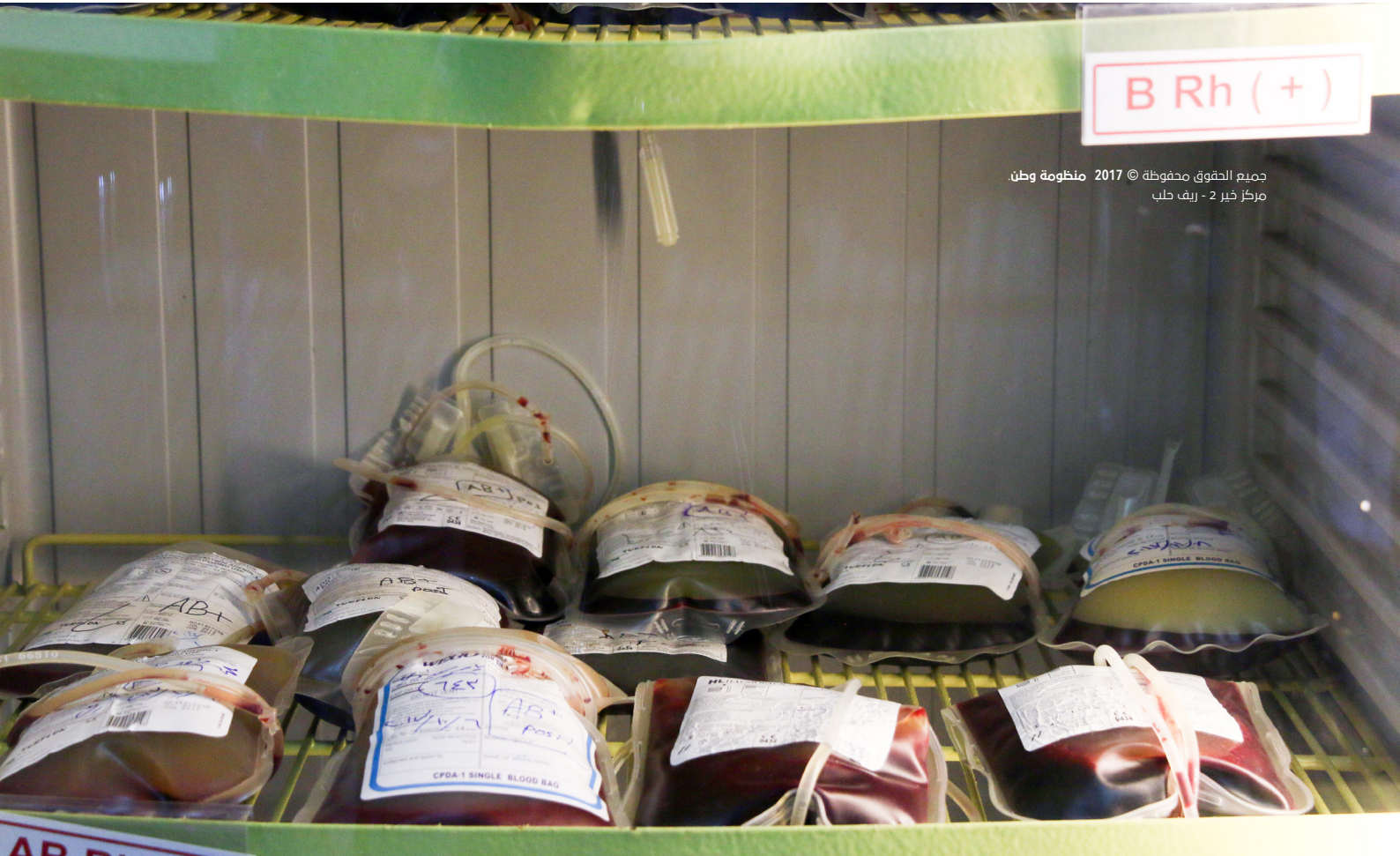
جميع الحقوق محفوظة © 2017 منظومة وطن. مركز خبير 2 - ريف حلب