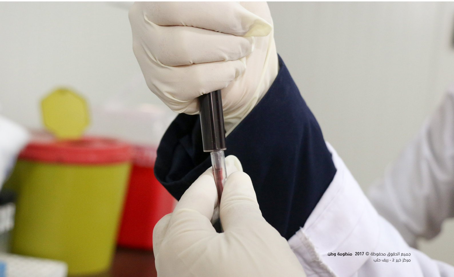
جميع الحقوق محفوظة © 2017 منظومة وطن. مركز خبير 2 - ريف حلب