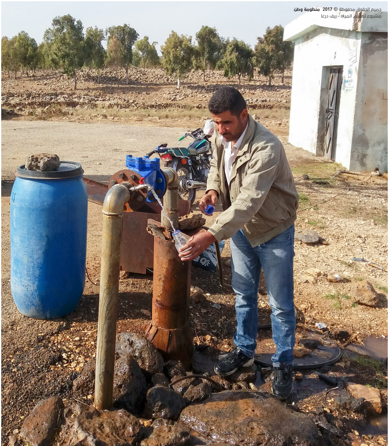
جميع الحقوق محفوظة © 2017 منظومة وطن. مشروع تعقيم المياه - ريف درعا