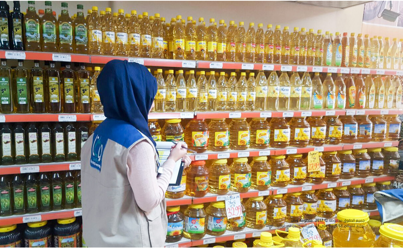
جميع الحقوق محفوظة © 2017 منظومة وطن توزيع منتجات الكرونية على اللاجئين السوريين في تركيا - اوما